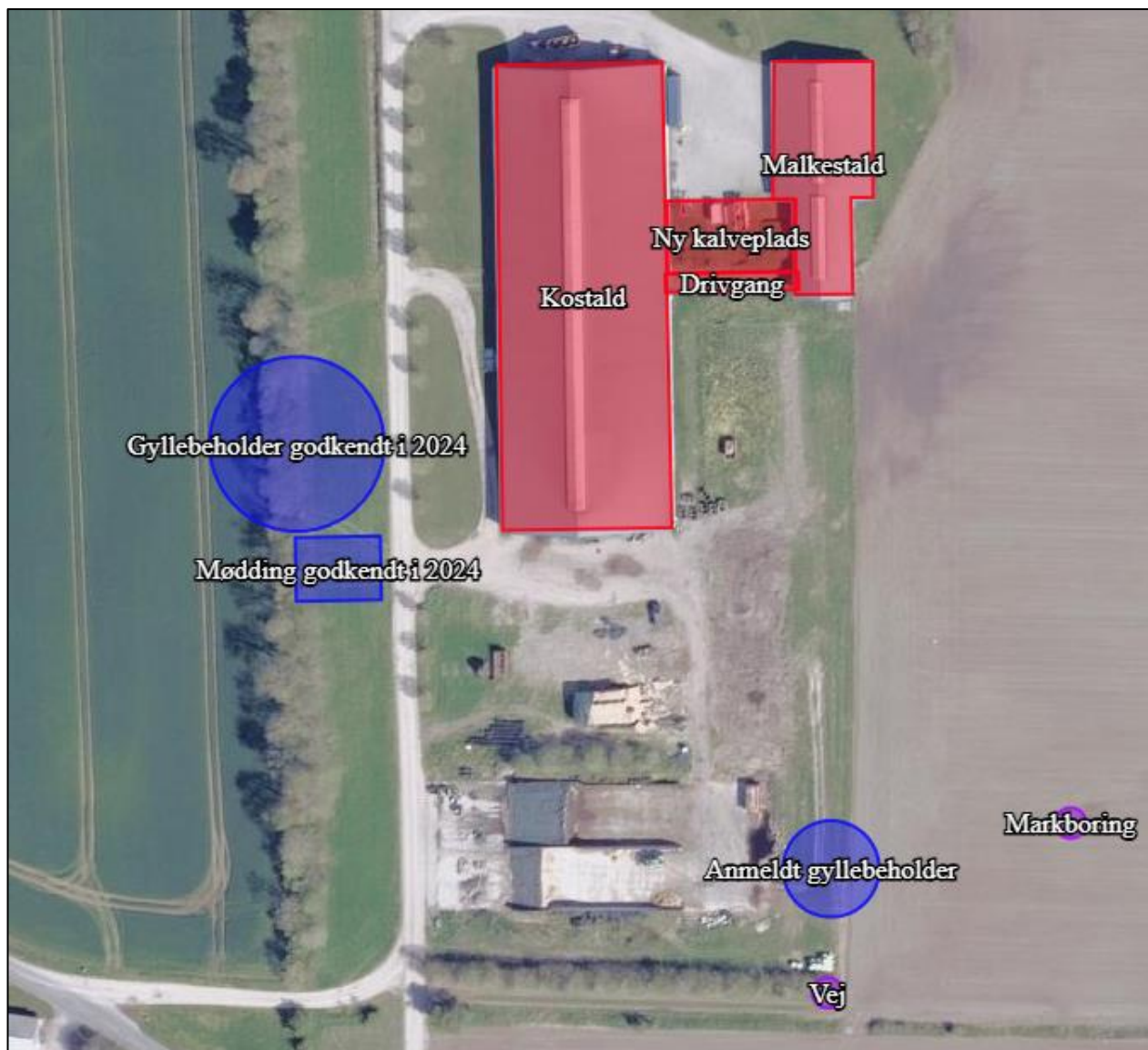
Figur 1. Placering af ny gyllebeholder i forhold til eksisterende bygninger og beplantning samt, vej og markboring.

Gyllebeholderen kommer til at ligge ca. 17-18 m fra vejmatrিকlen syd for ejendommen.